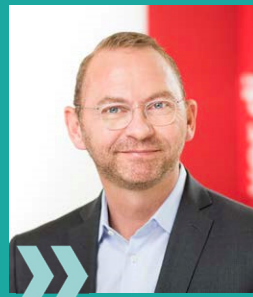
Frank Werneke ver.di-Vorsitzender

Dieser Tarifvertrag, der nur zeitlich befristet zur Krisenbewältigung gelten soll, muss insbesondere Regelungen zum Ausschluss betriebsbedingter Kündigungen, zu einem Aufstockungsbetrag des Kurzarbeitergeldes, um reale Entgeltausfälle weitestgehend abzumildern oder gar komplett zu beseitigen und Schutzbestimmungen für Risikogruppen enthalten.